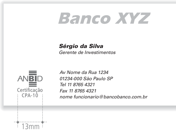
Cartão de visitas do banco com selo ANBID CPA-10