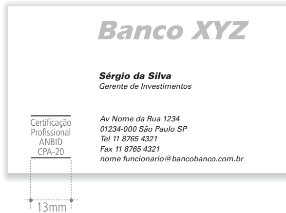
Cartão de visitas do banco com versão alternativa do selo ANBID CPA-20