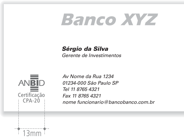
Cartão de visitas do banco com selo ANBID CPA-20