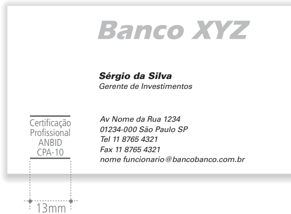
Cartão de visitas do banco com versão alternativa do selo ANBID CPA-10